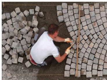
Strassen-Pflasterer bei der Arbeit